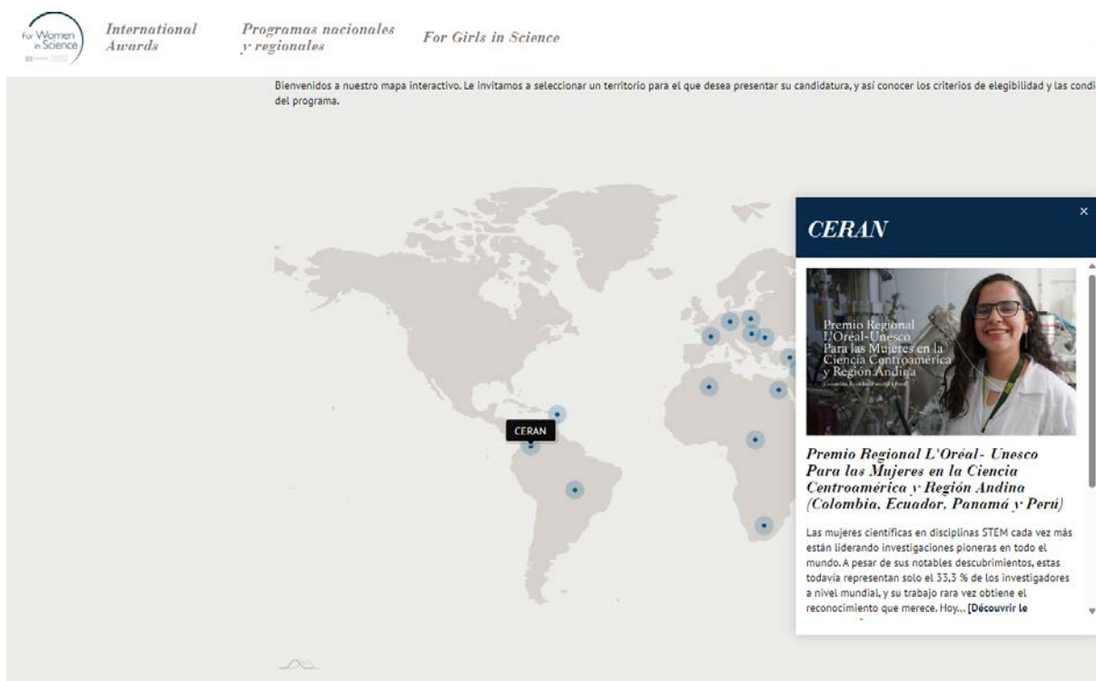
Figura N° 3 y 4: Pantalla de Selección de Programa- National and Regional Programs