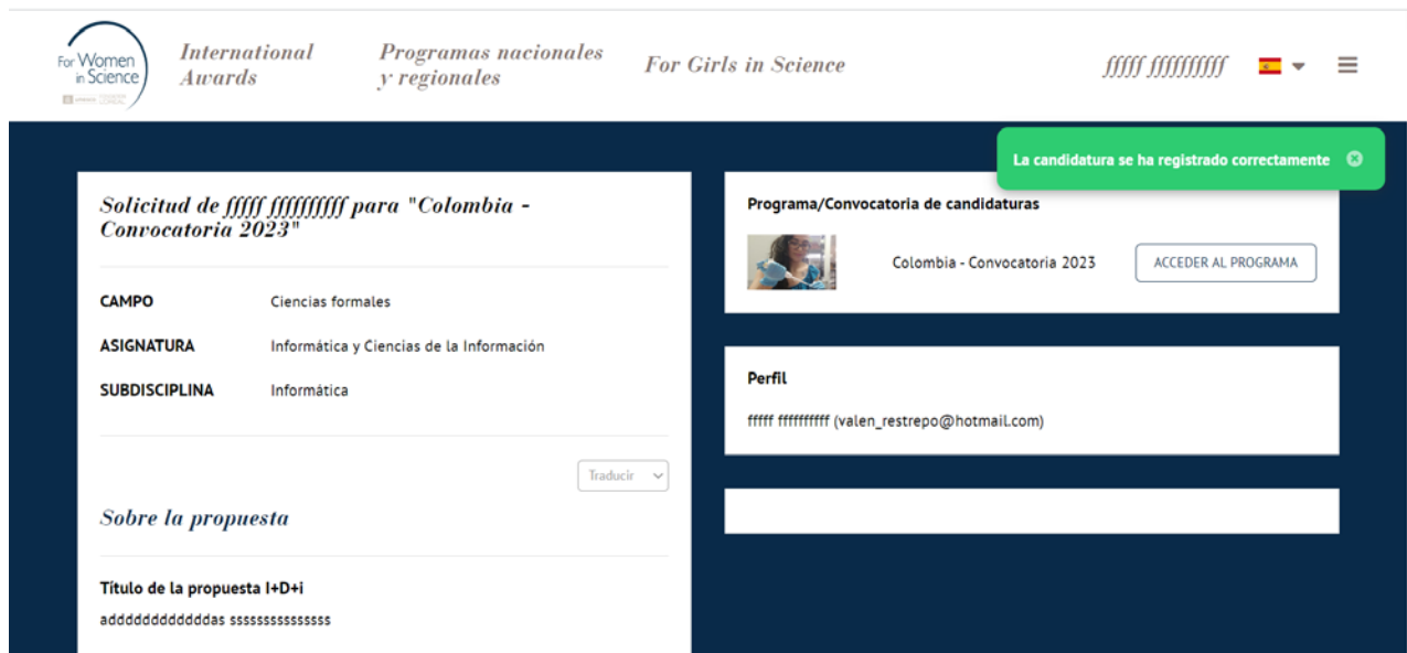
Figura N° 6: Pantalla de validación

Tenga en cuenta que este correo electrónico puede llegar a su correo no deseado . Le invitamos a comprobarlo antes de ponerse en contacto con el equipo técnico. Mientras espera que nuestro equipo técnico se ponga en contacto con Usted, si no encuentra ningún correo electrónico de confirmación, ni en su buzón de correo electrónico, ni en su correo no deseado, puede comprobar si su solicitud ha sido enviada desde su panel de control, en mi cuenta . Si su solicitud sigue en estado borrador y puede editar, significa que no ha sido enviada.